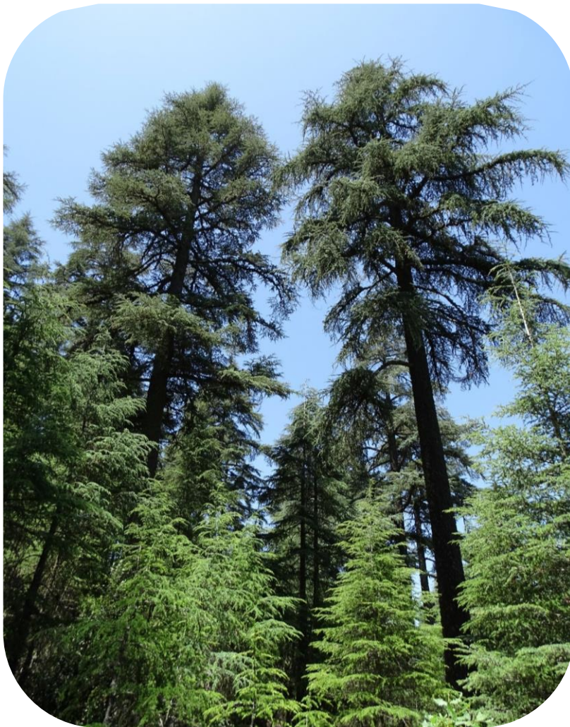
Atlaszeder im Rif-Gebirge