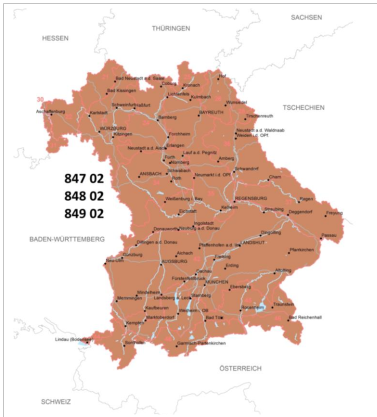
Herkunftsgebietskarte der Schwarzkiefer in Bayern (Karte: Daniel Glas, AWG)